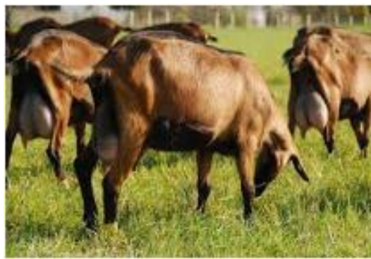
Alimentation par pâturage

PE4 : Il s'agit ici de voir quel type d'alimentation est principalement servi aux animaux.