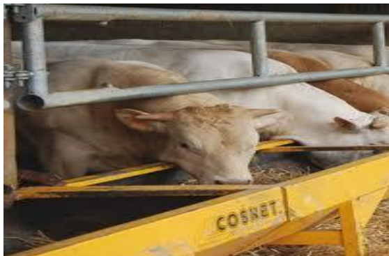
Alimentation à l'auge